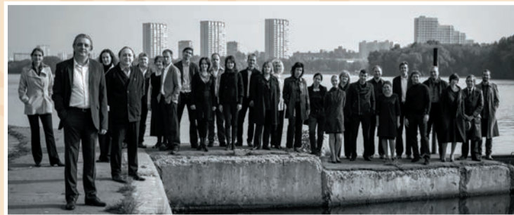
Ансамбль солистов «СТУДИЯ НОВОЙ МУЗЫКИ»